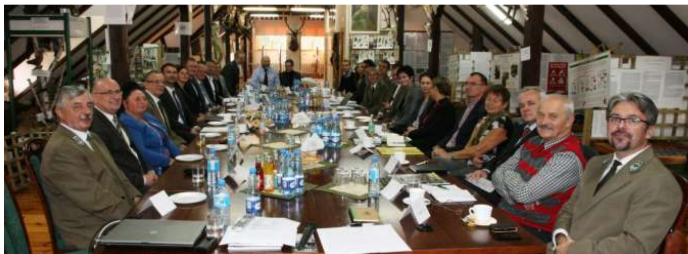
Fot 2. Jedno ze spotkań zainteresowanych stron.