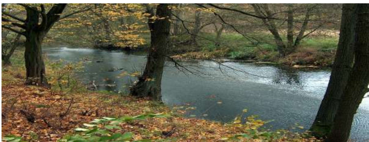
Fot 1. Dolina Welny

Dokument uzgodniony przez 17 Partnerów – Sygnatariuszy Deklaracji wspólnego działania w ramach Lasu Modelowego w Obornikach oraz realizacji założeń Planu Strategicznego na lata 2015-2022