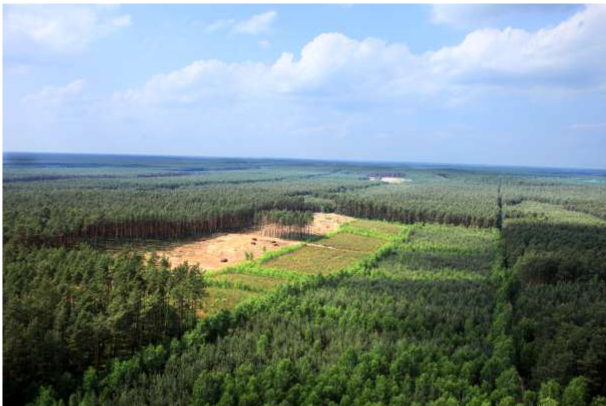
Fot 3. Puszcza Notecka.

poznańskiego. Całkowita powierzchnia jednostki wynosi 60 000 ha. Około 30 % obszaru pokrywają lasy, rosnące na ubogich piaszczystych glebach. Pozostały teren to grunty gmin miejskich i dobrze zagospodarowanych rolniczo gmin wiejskich.